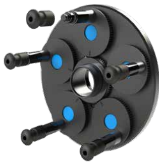
8-21100294 PPF FASTPLATE 5

für 5-Loch-Felgen Spannbereich 95,25 - 180 mm