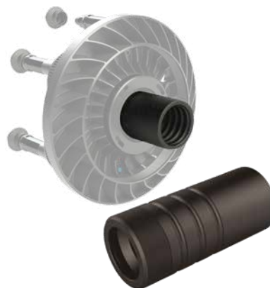
8-21100297 PPF-C SLEEVE HANDLE

Muffe für Auswuchtmaschinen mit automatischer Einspannung. Wird direkt an FASTPLATE angeschraubt, um bequemer und schneller zu arbeiten.