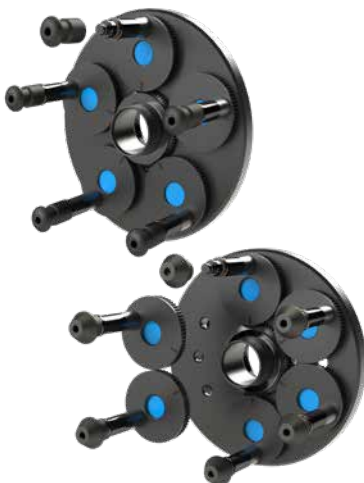
8-21100296 PPF FASTPLATE KIT

für Felgen mit 3-4-5- 6-8 Löchern Spannbereich 95,25 - 180 mm