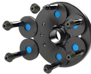
8-21100295 PPF FASTPLATE 3-4-6-8

für Felgen mit 3-4-6-8 Löchern Spannbereich 95,25 - 180 mm